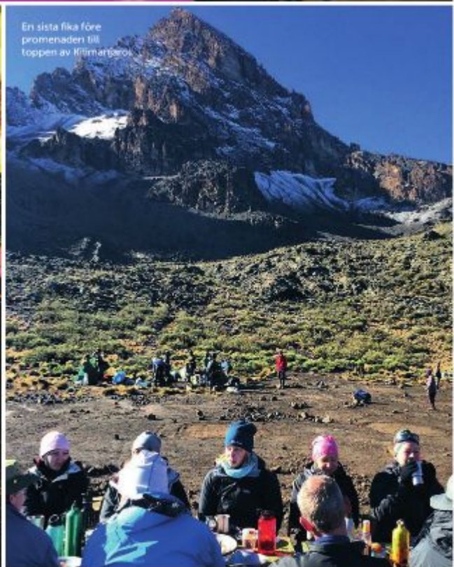
En sista fika före promenaden till toppen av Kilmamboro.