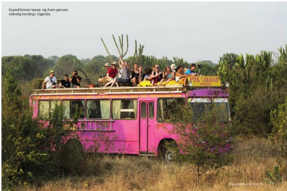
Expeditionen banar sig fram genom oändlig terräng i Uganda.